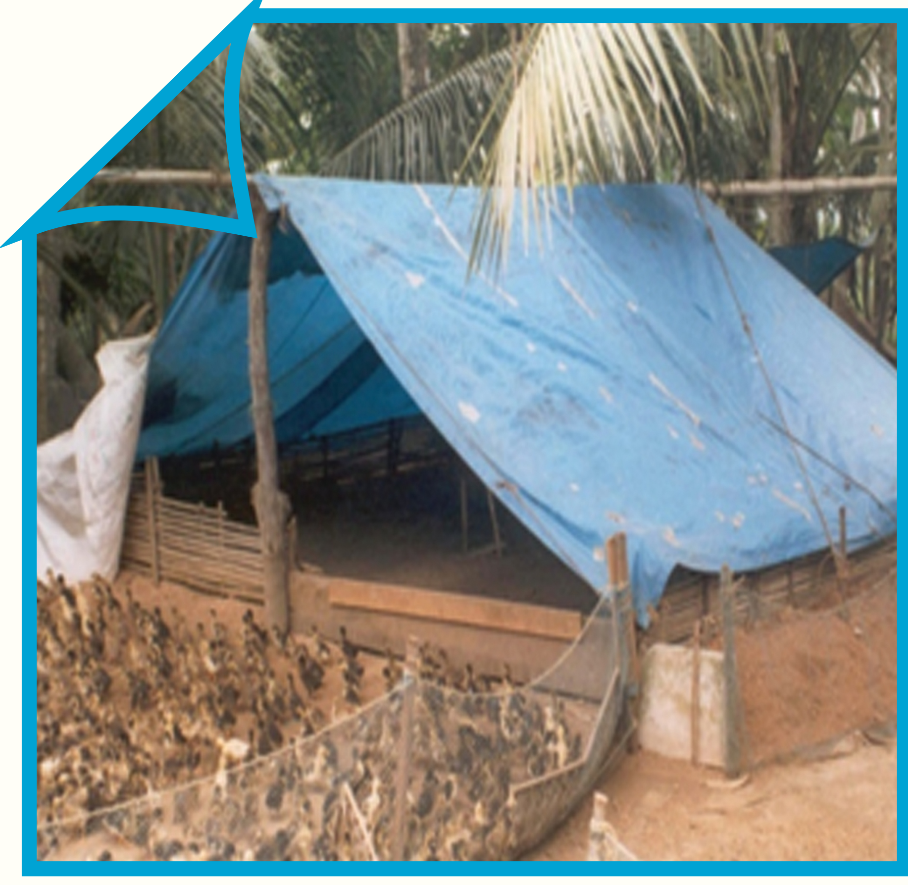
இளம் வாத்துகளுக்கான வீட்டமைப்பு