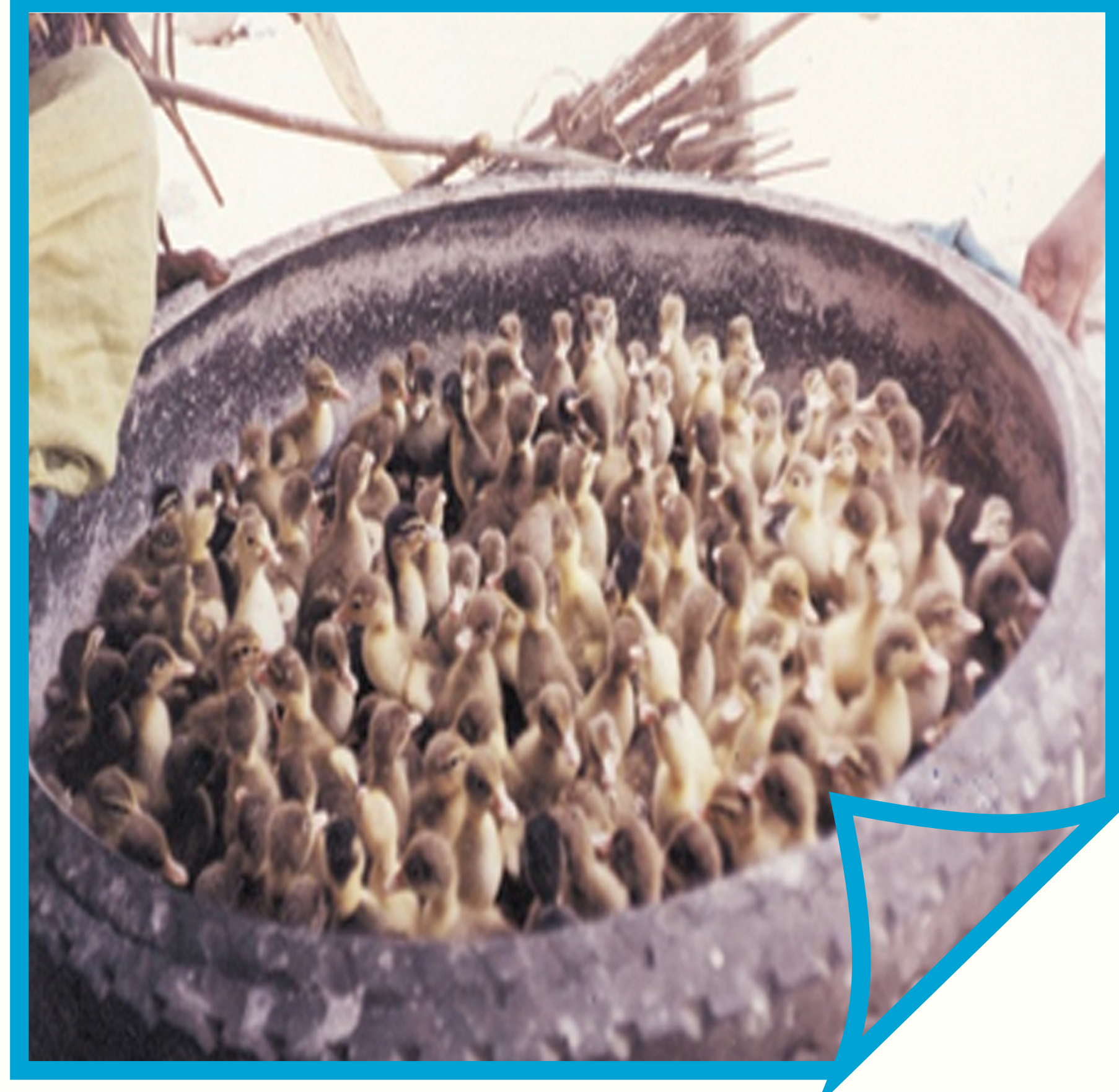
லாரியின் பழைய டயரில் குஞ்சுகளை வளர்த்தல்