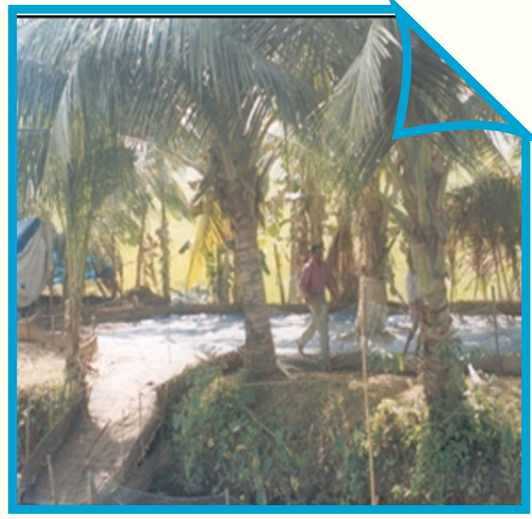
வாத்துகள் தங்குமிடத்திற்கு அருகே தண்ணீரில் இறங்குவதற்கு ஏதுவாக சாரம்