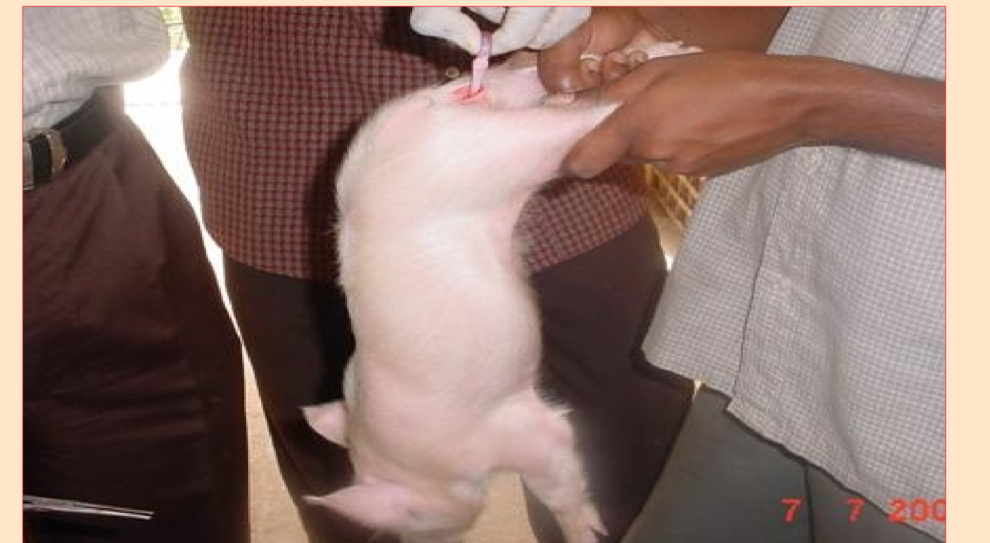
ஆண்மை நீக்கம் செய்தல்