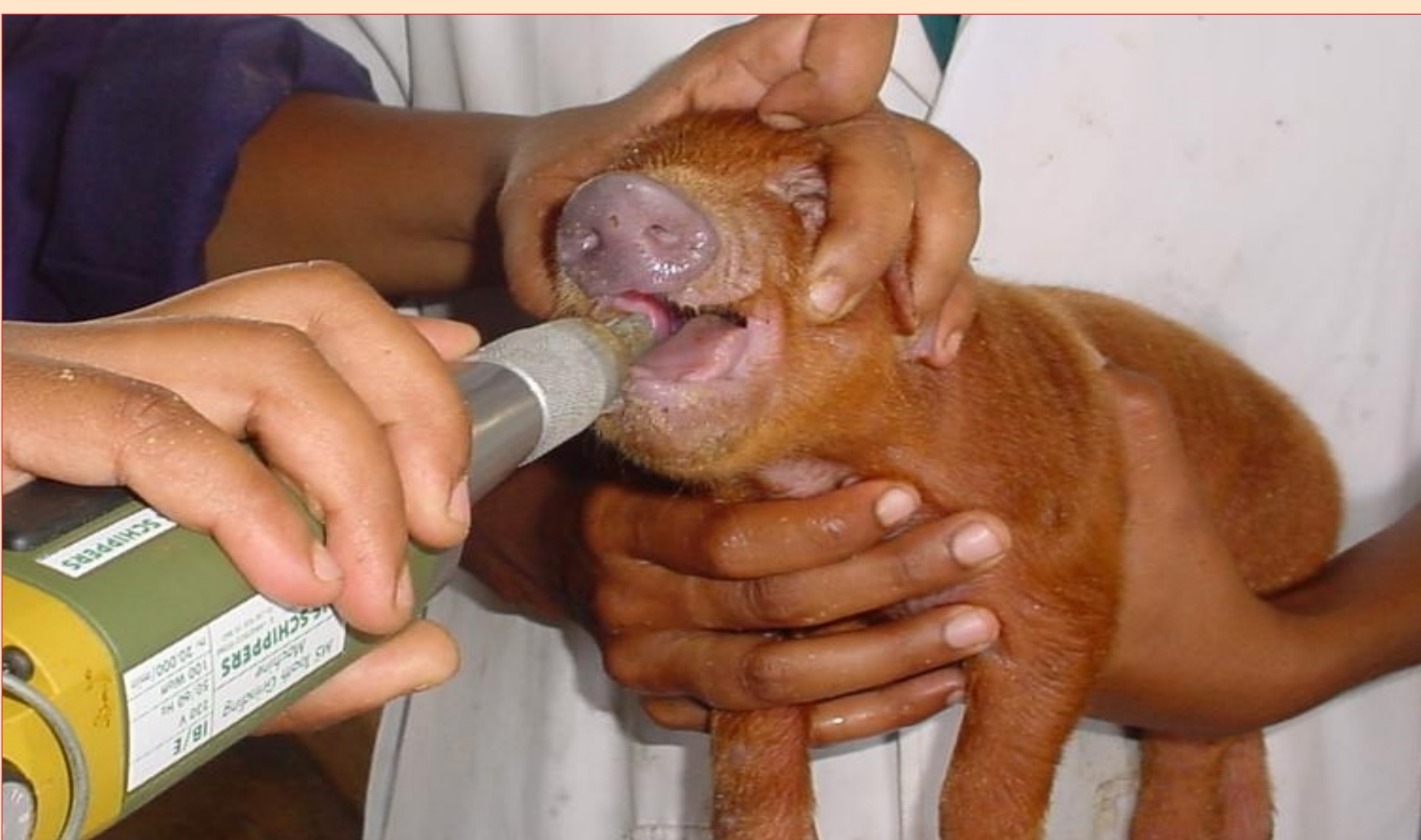
கோர்ப் பற்களை வெட்டுதல்