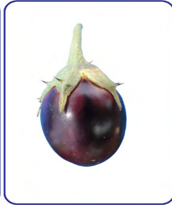
VRM (Br) 1