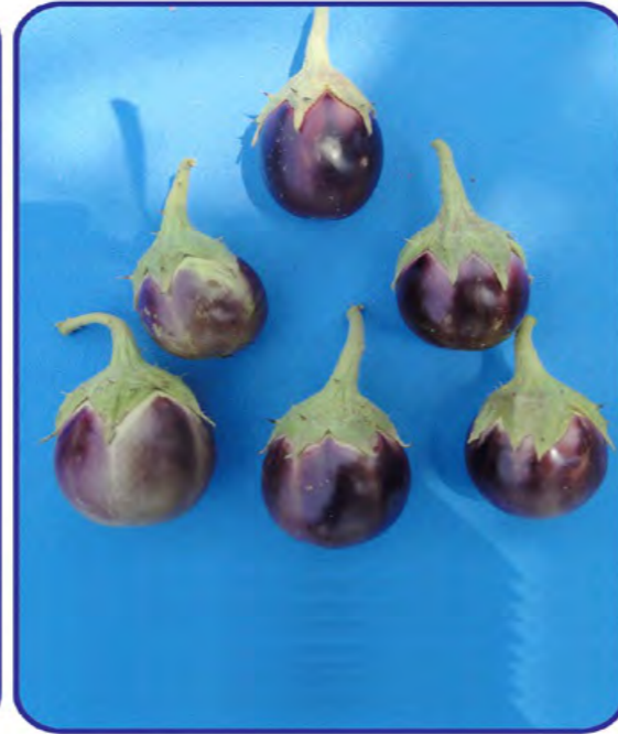
VRM (Br) 1