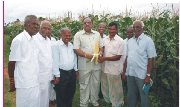
வேளாண்மைப் பல்கலைக்கழக துணைவேந்தர் சி.எம்.எச்.08-282 வீரிய ஒட்டு மக்காச்சோள செயல் விளக்க திடல்களைப் பார்வையிடல் - வடக்கிபாளையம்

வேளாண்மைப் பல்கலைக்கழகத்தில் மக்காச்சோள ஆராய்ச்சிக்கு முன்னுரிமை கொடுத்து பல புதிய அதிக விளைச்சலை தரும் ஒரு வழி வீரிய ஒட்டுகளை வேளாண்மைப் பல்கலைக்கழகம் உருவாக்கி வருகின்றது. அவற்றில் உற்பத்தித் திறனை அதிகரிக்கவும், பூச்சி, பூஞ்சாண நோய்களுக்கு எதிர்ப்புத் திறன் மற்றும் தொழிற்சாலைகளுக்கு ஏற்ற வகையிலும் உருவாக்க மேற்கொள்ளப்பட்ட ஆராய்ச்சின் பலனாக, உயிர் விளைச்சல் தரும்