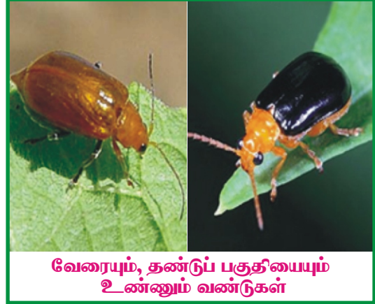
வேரையும், தண்டுப் பகுதியையும் உண்ணும் வண்டுகள்