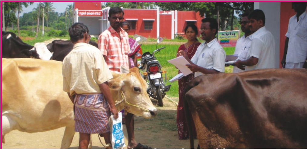
நுண்ணூட்டக் கலவைப் பற்றி உழவர்களுக்கிடையே விழிப்புணர்வு

தமிழகத்தின் ஒவ்வொரு பகுதிகளில் உள்ள பசுமாடுகளுக்கு தீவனங்களை வழங்குவதில் உழவர்களிடம் வேறுபாடுகள் காணப்படுகின்றன. இதனால் பசுமாடுகளுக்குத் தேவையான அனைத்து நுண்ணூட்டச் சத்துக்களும் கிடைப்பதில்லை. இக்குறைபாட்டை போக்க "பகுதிகேற்ற நுண்ணூட்டச் சத்துக் கலவைகளைப்" பெற கால்நடைத்துறை, வேளாண் அறிவியல் நிலையங்களைத் தொடர்பு கொண்டு உரிய ஆலோசனைகளைப் பெறலாம்.