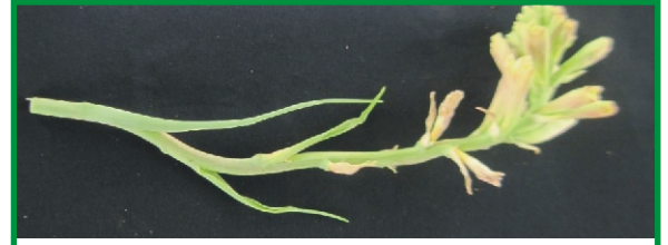
இலைப்பேன் தாக்கிய பூக்கள்