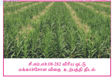
சி.எம்.எச்.08-282 வீரிய ஒட்டு மக்காச்சோள விதை உற்பத்தி திடல்

தமிழ்நாட்டில் தானியப் பயிர் வகைகளில் மக்காச்சோளம் ஒரு முக்கியப் பயிராகும். இந்தியாவில் நெல், கோதுமை இவற்றிற்கு அடுத்தபடியாக மக்காச்சோளம் அதிக அளவில் பயிரிடப்படுகின்றது. சாகுபடி பரப்பளவிலும், உற்பத்தியிலும் இப்பயிர் மூன்றாவது இடத்தில் இருக்கின்றது.