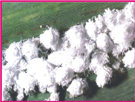
கரும்பைத் தாக்கும் வெள்ளைக் கம்பள அசுவிணி

என்னோட பேரு டைஃபா எபிடிவோரா ... நான் லெபிடாப்டிரா (அந்துப் பூச்சி) இன வகையைச் சார்ந்த இரை விழுங்கி... எங்களுடைய தாய் அந்துப்பூச்சிகள் ஒவ்வொருவரும் 80 முட்டைகளை உருவாங்க.... அதுல