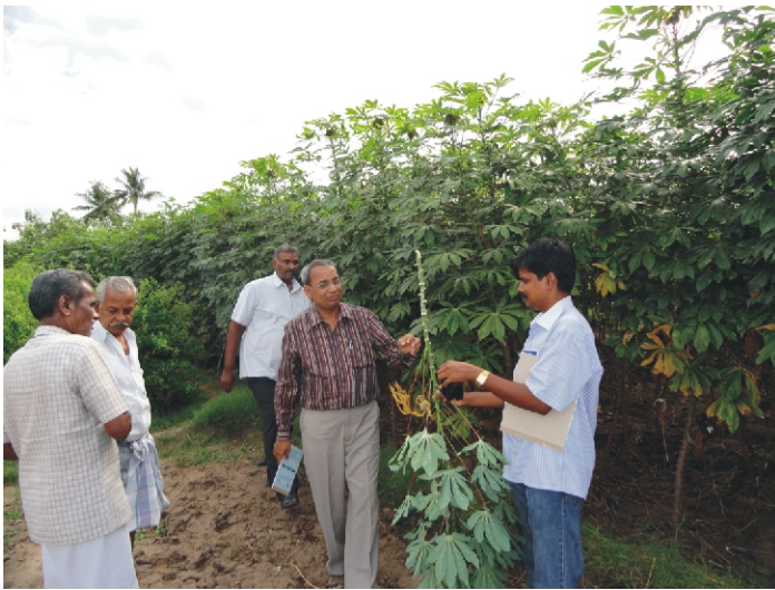
உழவரின் வளரும் வேளாண்மை