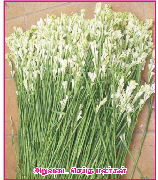
அறுவடை செய்த மலர்கள்

கிழங்கை மண்ணிலிருந்து எடுத்த 4-5 வாரங்களில் நட வேண்டும். உடனடியாக நடவு செய்தால்