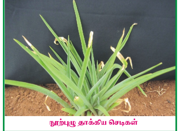
நூற்பூ தாக்கிய செடிகள்

செடிகள் பூக்க ஆரம்பிக்கும். உதிரி மலராக பயன்படுத்துவதற்கு அடுத்த நாள் மலரும் மொட்டுக்களைப் பூங்கொத்தில் இருந்து ஒவ்வொரு பூவாக பிரிக்க வேண்டும். ஆனால், கொய்மலருக்கு, பூங்கொத்தினை அப்படியே பிரிக்காமல் பயன்படுத்த வேண்டும். இவற்றை அறுவடை செய்யும்பொழுது பூங்கொத்தின் அடியில் உள்ள 1-2 ஜோடி மலர்கள் விரிந்திருக்க வேண்டும். ஆனால், வாசனைப் பொருளான மெழுகு (concrete) தயாரிப்பதற்கு பூக்களை காலை 8 மணிக்குள் பூக்கள் மலரத் தொடங்கும்போது பறிக்க வேண்டும்.