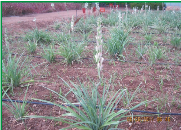
நிலச்சம்பங்கியில் சொட்டு நீர்ப்பாசனம்

நடவு செய்வதற்கு 2-3 வாரங்களுக்கு முன்னர், தொழு உரம் 20 முதல் 25 டன் வரை ஒரு எக்டருக்கு இட வேண்டும். அவற்றுடன் 200 முதல் 400 கிலோ தழைச்சத்து, 200-250 கிலோ மணிச்சத்து, 100-200 கிலோ