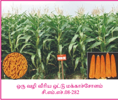
ஒரு வழி வீரிய ஒட்டு மக்காச்சோளம் சி.எம்.எச்.08-282

சிறுதானிய மேம்பாடு நிலையம் பயிர் பெருக்க மற்றும் மரபியல் மையம் கோயம்புத்தூர்-641 003 அலைபேசி எண் : 94869 13279