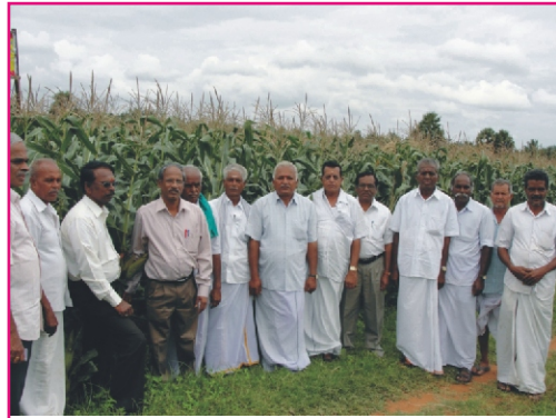
வேளாண்மைப் பல்கலைக்கழக ஆராய்ச்சி இயக்குநர் மற்றும் விரிவாக்கக் கல்வி இயக்குநர் சி.எம்.எச்.08-282 வீரிய ஒட்டு மக்காச்சோள செயல் விளக்க திடல்களைப் பார்வையிடல் - வடக்கிபாளையம்

இவ்வகை வீரிய ஒட்டு இரகம், அதிக மாவுச்சத்து (76.3%), அதிக புரதம் (11.25%), அதிக பீட்டா கரோடீன் (0.48 மி.கி/100கிராம்), நடுத்தர அளவு கொழுப்புச்சத்து (4.65%), நார்ச்சத்து (1.29%) கொண்டது. மேலும், மேடிஸ், டர்சிகம் இலைக்கருகல் நோய், அடிச்சாம்பல் நோய், பூத்தப்பின் வரும் தண்டு அழுகல், பாக்கீரியா இலைக்கருகல் ஆகிய நோய்களுக்கு எதிர்ப்புத் திறன் கொண்டுள்ளது.