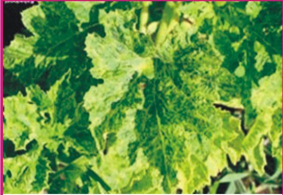
மொசைக் நச்சுயிரி நோய்

சிறிய வெள்ளை அல்லது அழுக்குச் சாம்பல் நிறப்புள்ளிகள் இலைகள், இலைக்காம்புகள், இளந்தண்டுகளின் மேல் தோன்றும். பின்னர் அவை பெரியதாகி மாவுப் பூச்சாக மாறும். இந்நோய் மழை இல்லாத அதிக வெப்பம் உள்ள காலங்களில் தோன்றி பரவக் கூடியது.