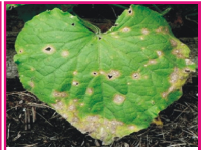
அடிச் சாம்பல் நோய்