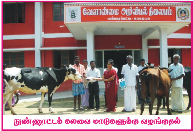
நுண்ணூட்டக் கலை மாடுகளுக்கு வழங்குதல்

தேவையான அளவைவிட, குறைந்தளவே நுண்ணூட்டச் சத்துக்கள் பசுமாடுகளுக்கு கிடைக்குமாயின் பலவித உடல் ரீதியான குறைப்பாடுகள் தோன்றும். இதனால் பசுக்களில் உடல் வளர்ச்சிக் குன்றி, இனப்பெருக்கத் திறனில் பாதிப்பு, பால் உற்பத்தி குறைவு போன்ற விளைவுகள் ஏற்படுகின்றன. இதனைக் கருத்தில் கொண்டு பாப்பாரப்பட்டியில் உள்ள வேளாண் அறிவியல் நிலையத்தால், பசுமாடுகளுக்கு நுண்ணூட்டச்சத்து மேலாண்மை பண்ணை ஆய்வு மேற்கொள்ளப்பட்டது.