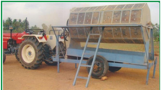
மஞ்சளை மெருகேற்றும் இயந்திரம்

ரூ.50/- வசூலிக்கின்றனர். தொடக்க வேளாண்மைக் கூட்டுறவு கடன் சங்கங்களில் உள்ள வேளாண் இயந்திர சேவை மையங்களில் உள்ள மஞ்சள் மெருகேற்றும் இயந்திரங்களில் ஒரு குவிண்டால் மஞ்சளை மெருகேற்ற ரூ.35/- மட்டுமே வசூலிக்கப்படுகின்றன. வேளாண் இயந்திர சேவை மையங்களில் ஒரு ஏக்கரில் வேகவைத்த உலர் மஞ்சள் 20 குவிண்டாலை (2 டன்) மெருகேற்ற ரூ.700/- வாடகையாக வசூலிக்கப்படுகின்றது. இவற்றிற்கு தனியார் ரூ.1000/- வசூலிக்கின்றனர்.