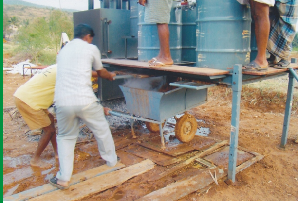
மஞ்சளை வேகவைக்கும் இயந்திரம்

இவ்வகையான மஞ்சள் வேகவைத்து பதப்படுத்துதலினால் எரிபொருள் மிச்சமாகின்றது. ஒரு குவிண்டாலை ஐந்து நிமிடங்களில் வேகவைத்துவிட முடிகிறது. அதிக அளவு உழைப்பு, மனித